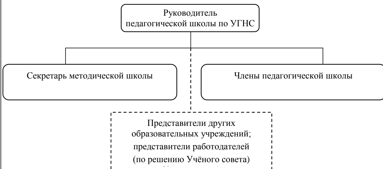
Рисунок 2- Структуру педагогической школы по УГНС